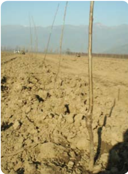
Figura 7 (profundidad de plantación)