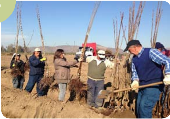
Figura 5 (Manipulación)