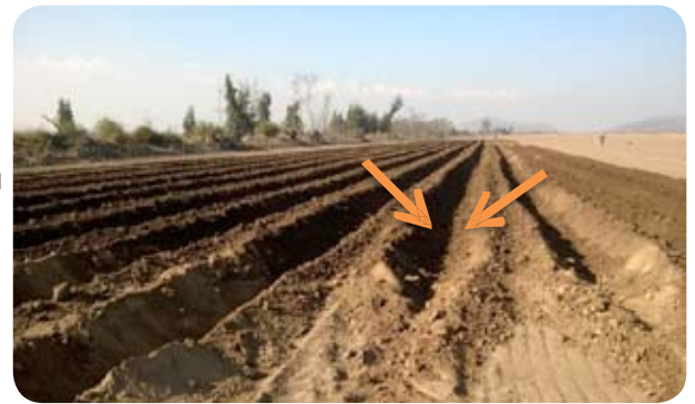
Figura 8 (zanja de plantación)