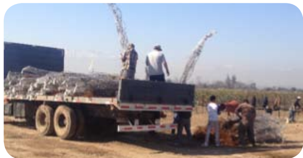
Figura 4 (carga y descarga manual)

Univiveros® NO recomienda, ni se hace responsable de la guarda de plantas en cámaras de frío