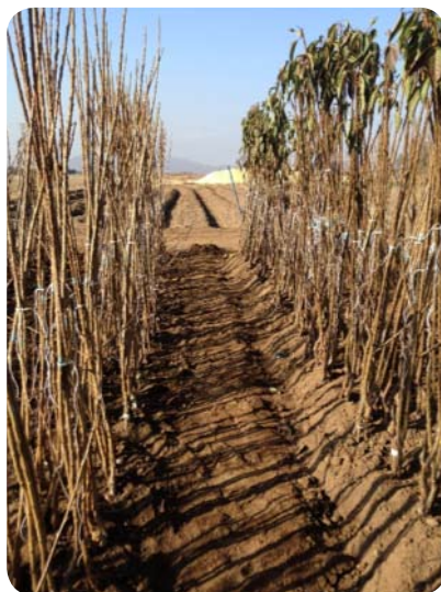
Figura 2 (barbecho)