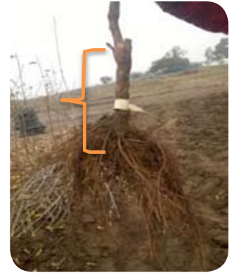
Figura 6 (Manipulación)