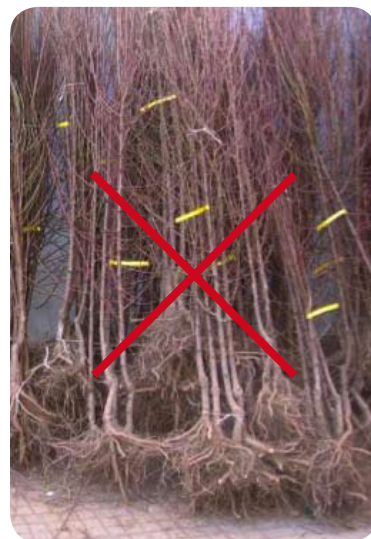
Figura 3 (NO acopiar así las plantas)